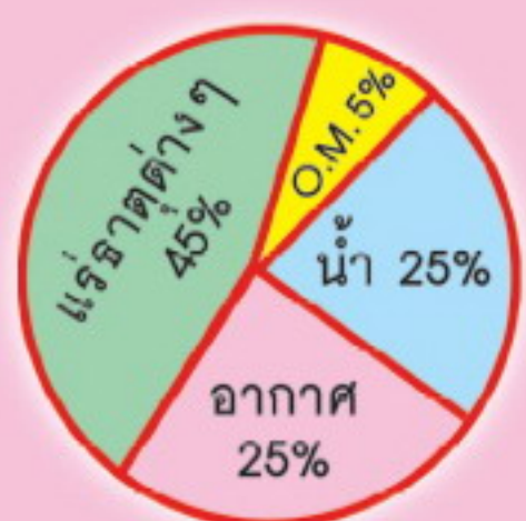
ลักษณะโครงสร้างของดินที่ดี

สนใจติดต่อได้ที่ : ร้านค้าตัวแทนจำหน่ายทั่วประเทศที่มีเครื่องหมาย ตราปลาบูไทย